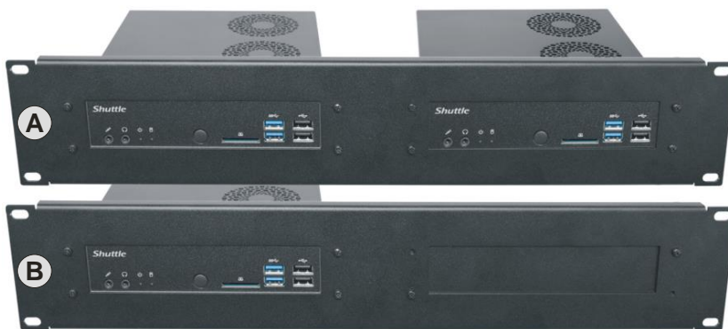
A) zwei montierte PCs B) nur ein PC - plus Abdeckplatte.